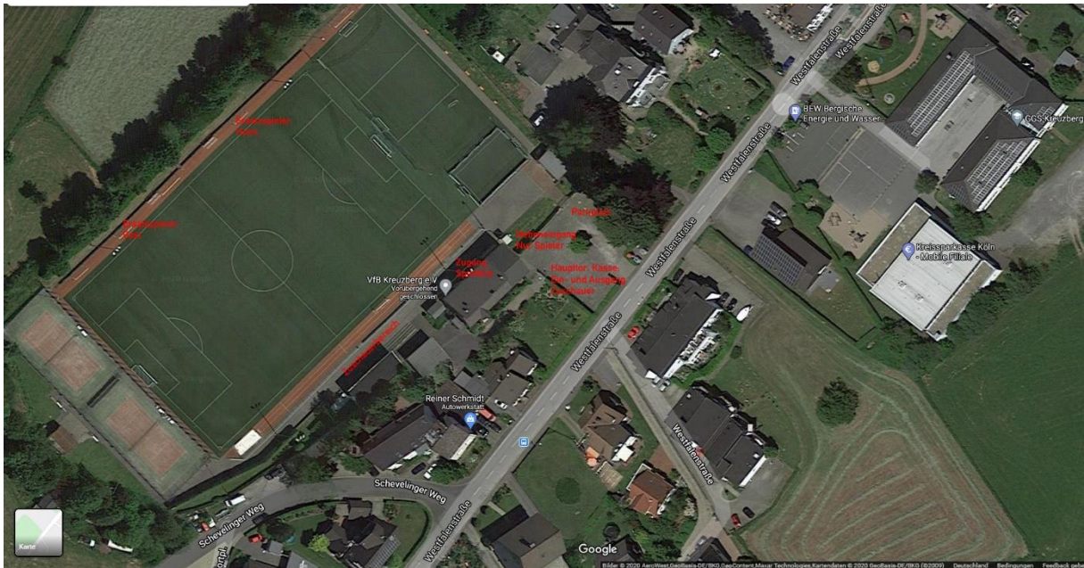
Abbildung 1 MPL Arena Kreuzberg