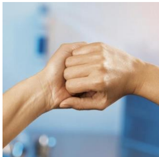
4 Mit verschränkten Fingern